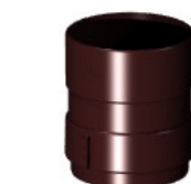
Муфта Ø 100 298 руб