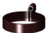
Хомут 183 руб