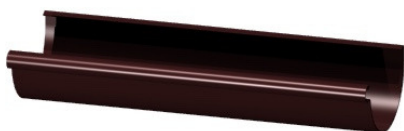
Желоб Ø 152 3м 653 руб